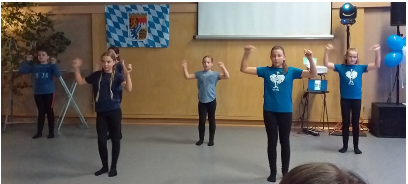
Im Hintergrund liefen Fotos aus 100 Jahren Vereinsgeschichte ab