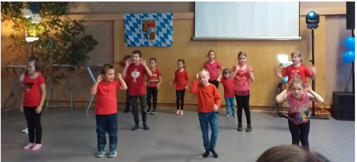
Tanzeinlagen der jüngsten Mitglieder der TSV-Sparte Turnen